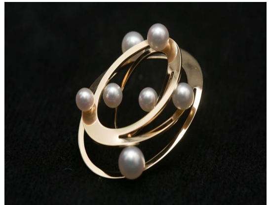
(伊勢志摩 G7サミット ラベルピン)